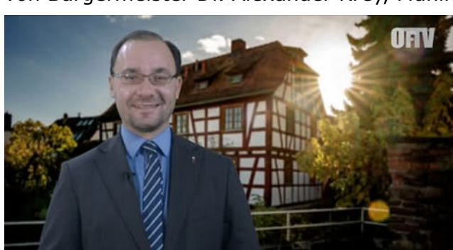
Bild auswählen, führt zum Video